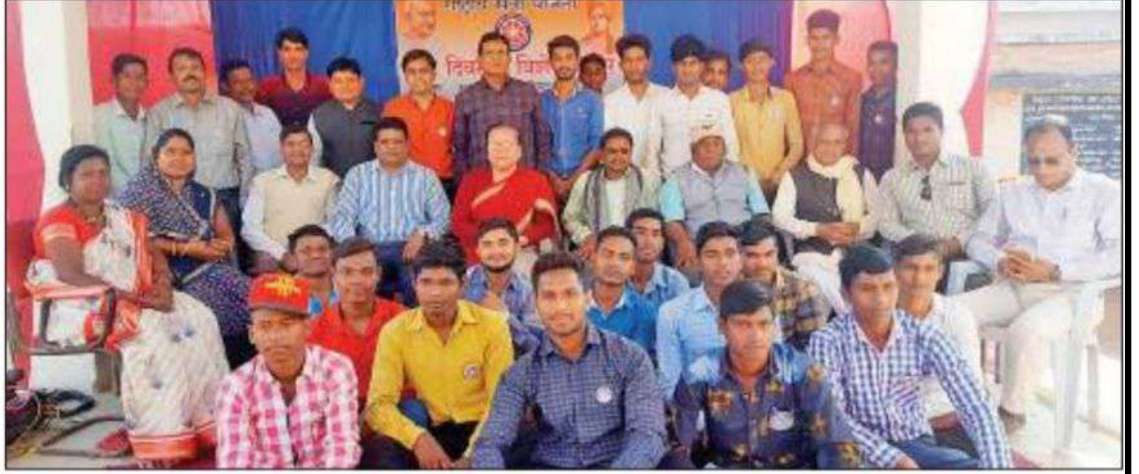
कोटा। मझगांव में आयोजित एनएसएस के शिविर में स्वयंसेवक